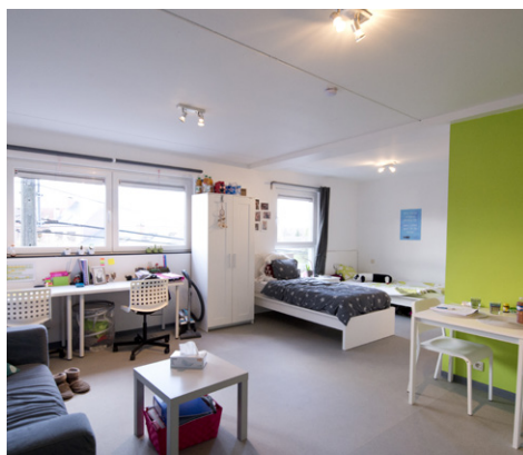
Avenue du Champs de Mars 19 – 7000 Mons