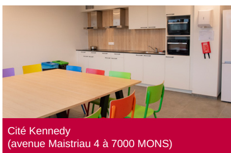
Cité Kennedy (avenue Maistriau 4 à 7000 MONS)