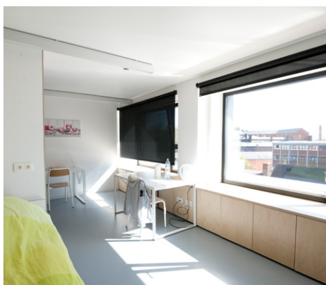
Rue de la Grande Triperie 30-34 – 7000 Mons