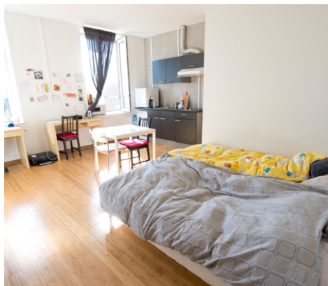
Rue de la Grande Triperie 11 – 7000 Mons