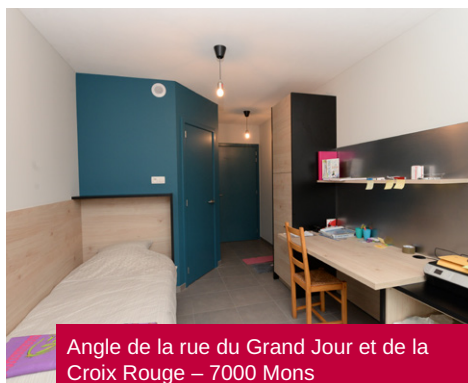
Angle de la rue du Grand Jour et de la Croix Rouge – 7000 Mons