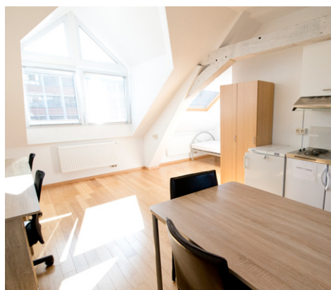
Rue de la Grande Triperie 11 – 7000 Mons