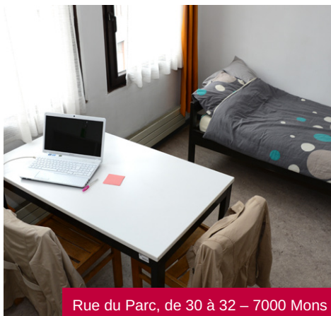
Rue du Parc, de 30 à 32 – 7000 Mons