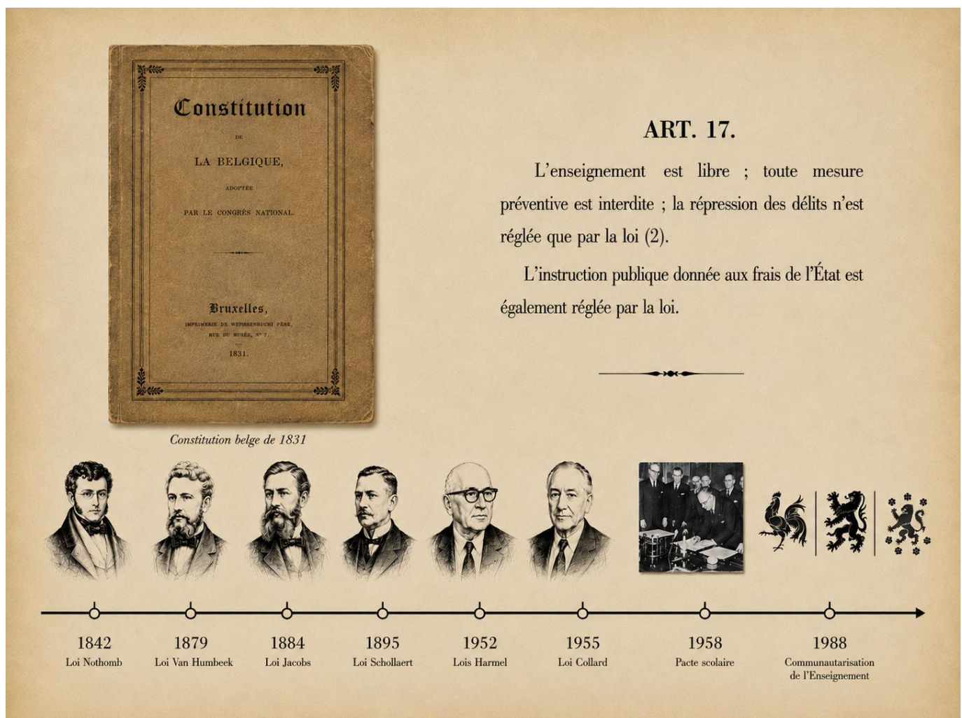
Figure 1 : Illustration des principales réformes de l'enseignement en Belgique, de la Constitution belge de 1831 à la Communautarisation de l'Enseignement en 1988, réalisée avec ChatGPT (OpenAI, 2026).