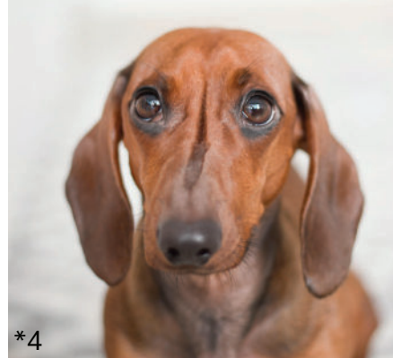
de la tristesse