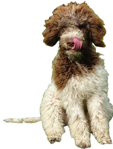
Il se lèche le museau