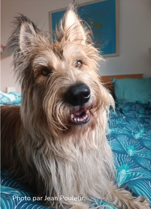
de la joie