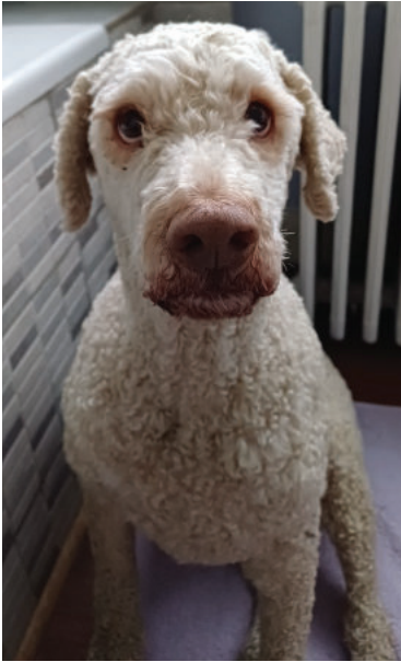
Il montre le blanc de ses yeux ("yeux de baleine")