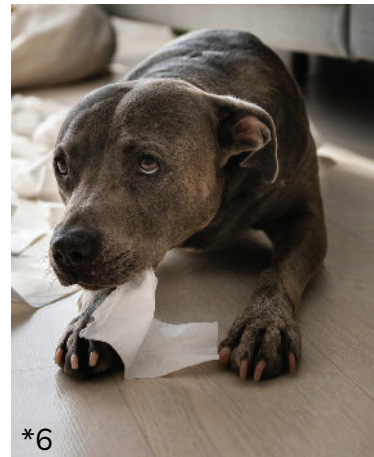
de la peur