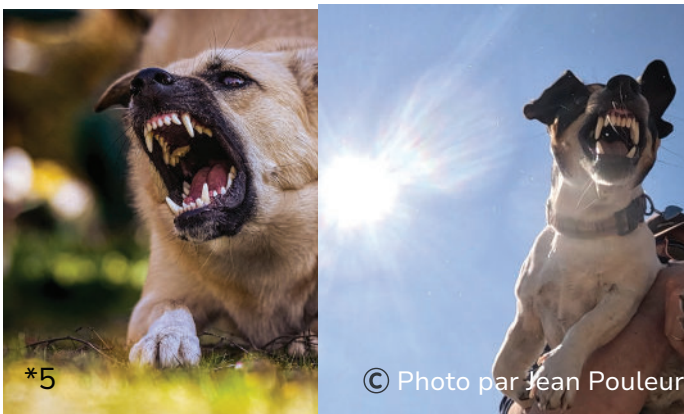
de la colère